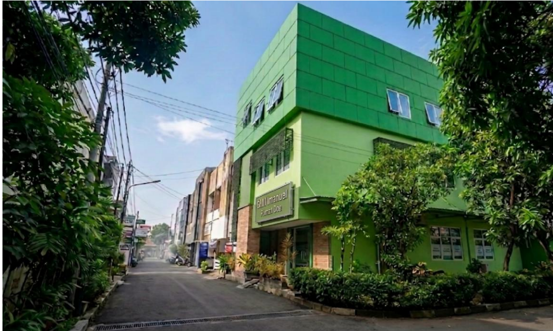
Gambar 1: Ilustrasi Gedung Gereja