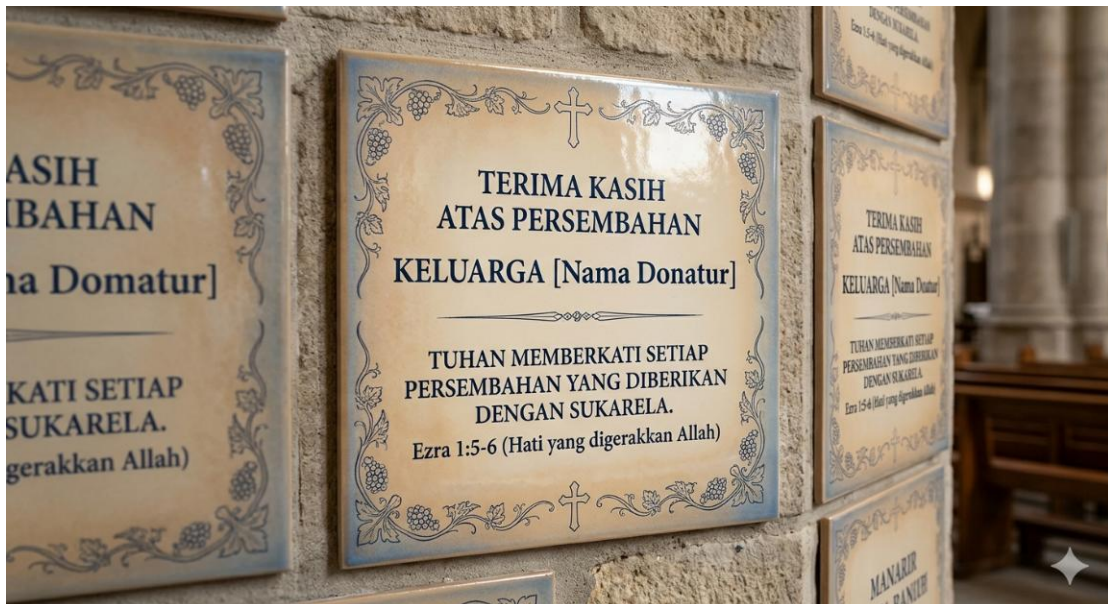
Gambar 3: Ilustrasi Keramik Dinding

Setiap akumulasi donasi dengan nilai kelipatan Rp 10.000.000 , nama donatur/keluarga akan diabadikan secara permanen pada (1) satu keramik dinding yang akan dipasang di area gedung gereja sebagai saksi sejarah pembangunan rumah Tuhan.