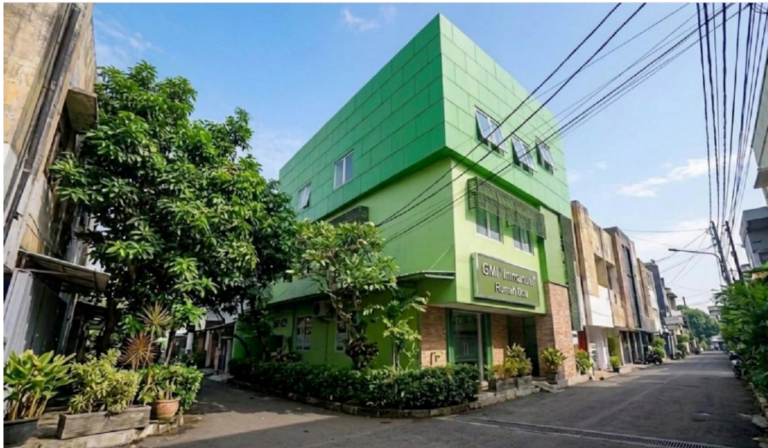
Gambar 2: Ilustrasi Gedung Gereja